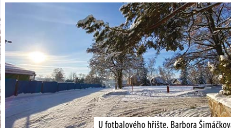
U fotbalového hřiště, Barbora Šimáčková