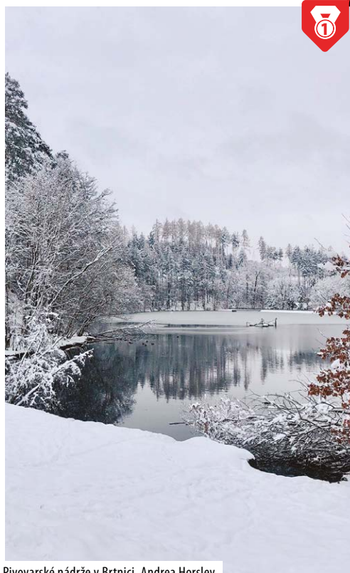
Pivovarské nádrže v Brtnici