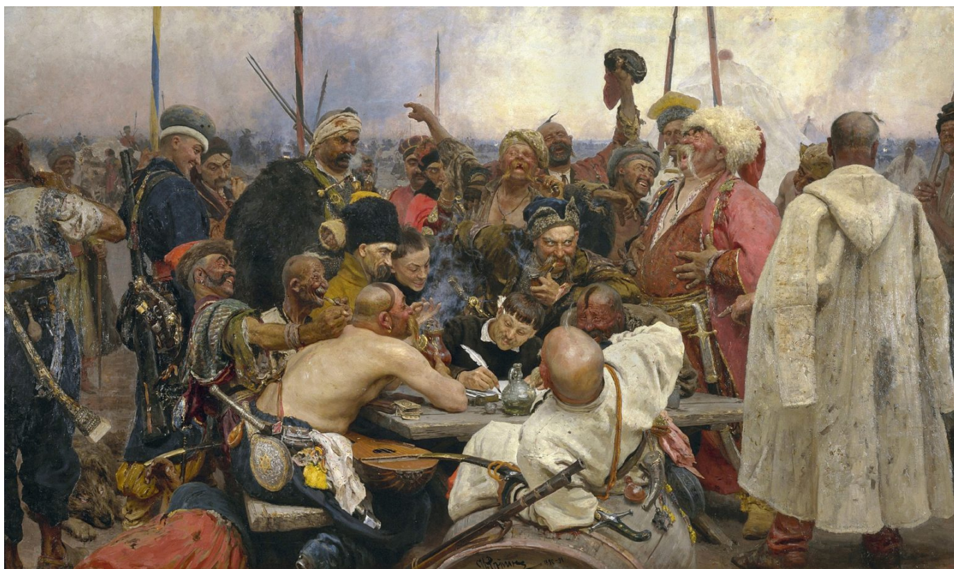
Obraz Záporožskí kozáci píšu list tureckému sultánovi od Iľja Repina.

Je to zrejme aj vďaka ruskému maliarovi Iľjovi Repinovi , ktorý v roku 1891 dokončil stvárnenie tohto výjavu na veľkolepom obraze. Na ňom sú vyobrazení kozáci, ktorí sa očividne zabávajú vymýšľaním farbistých odkazov pre Mehmeda IV. Výjav sa stal obľúbeným podkladom pre mnohé paródie alebo sa využíval v iných kontextoch.