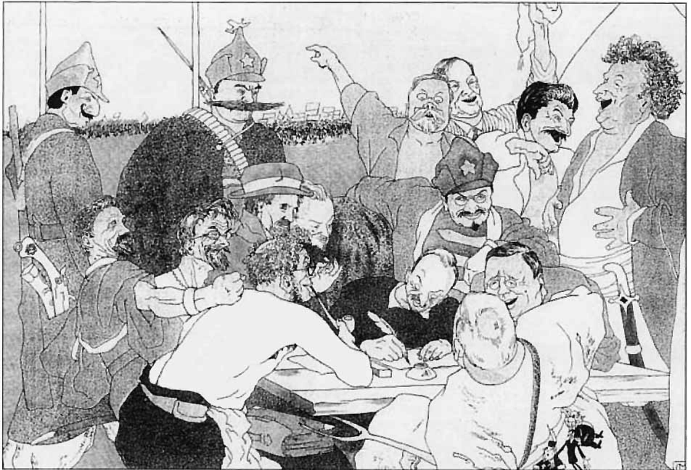
Bolševici píšú Curzonovi, rok 1923.

Známy je napríklad obrázok, v ktorom kozákov nahradili členovia ruskej dumy, alebo verzia z roku 1923, na ktorej bolševici píšú odpoveď Angličanovi menom George Curzon. V dnešnej dobe vznikajú úplne nové varianty, prevažne fotografie, dokonca aj v kontexte rusko-ukrajinského konfliktu.