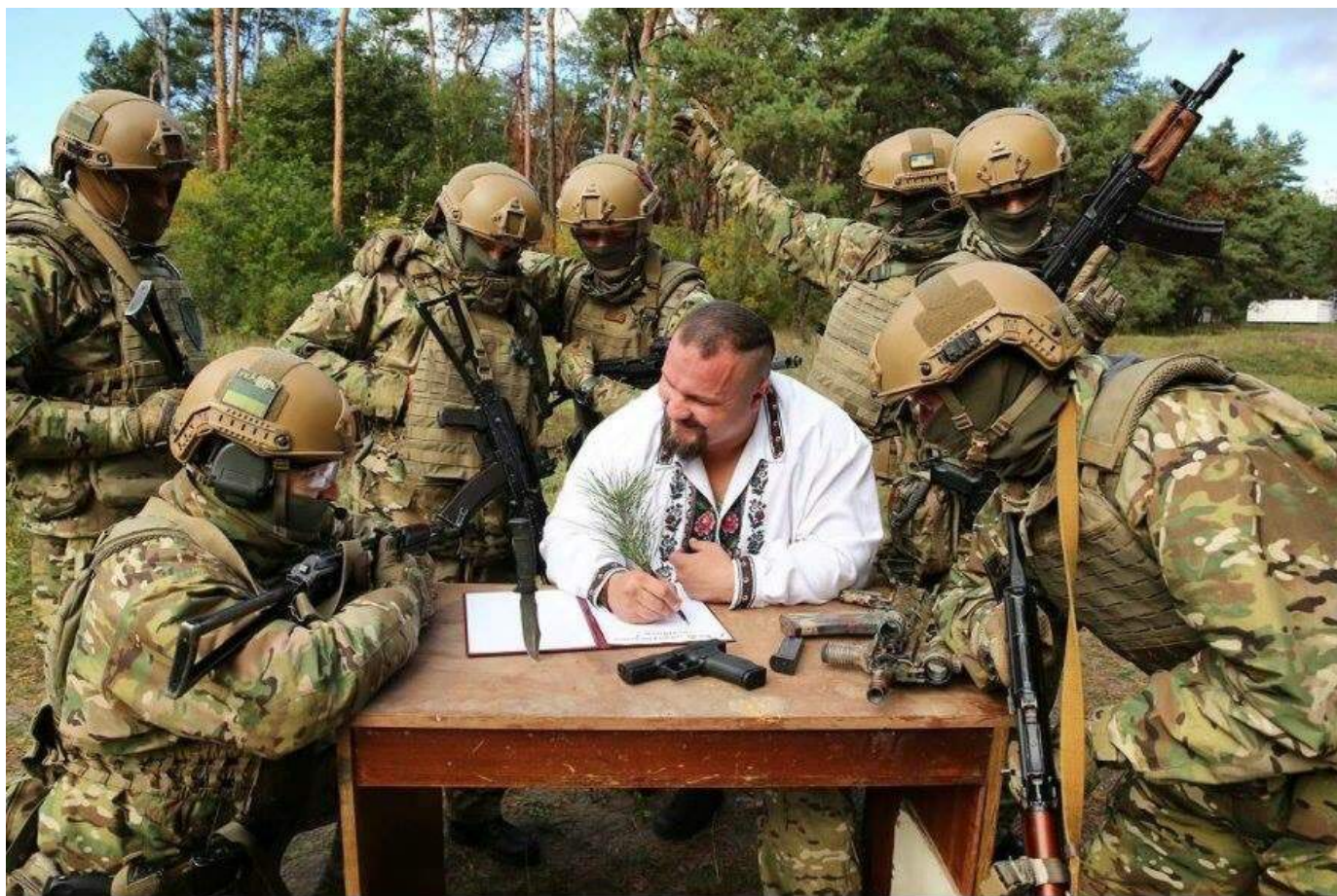
Variant obrazu z roku 2017.

Na podobnom princípe vznikla aj fotografia z roku 2017, na ktorej ukrajinskí vojaci píšu list Rusom. Sila bájnej a výsmešnej odpovede kozákov Osmanom je očividne stále prítomná a príbeh, aj keď sporný, žije naďalej.